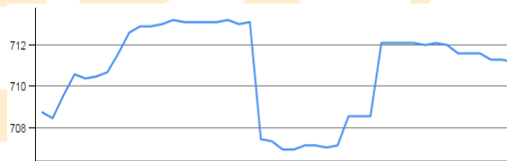
روند روزانه شاخص فرابورس: