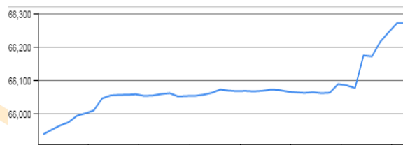
روند روزانه شاخص کل بورس اوراق بهادار: