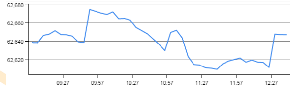
روند روزانه شاخص کل بورس اوراق بهادار: